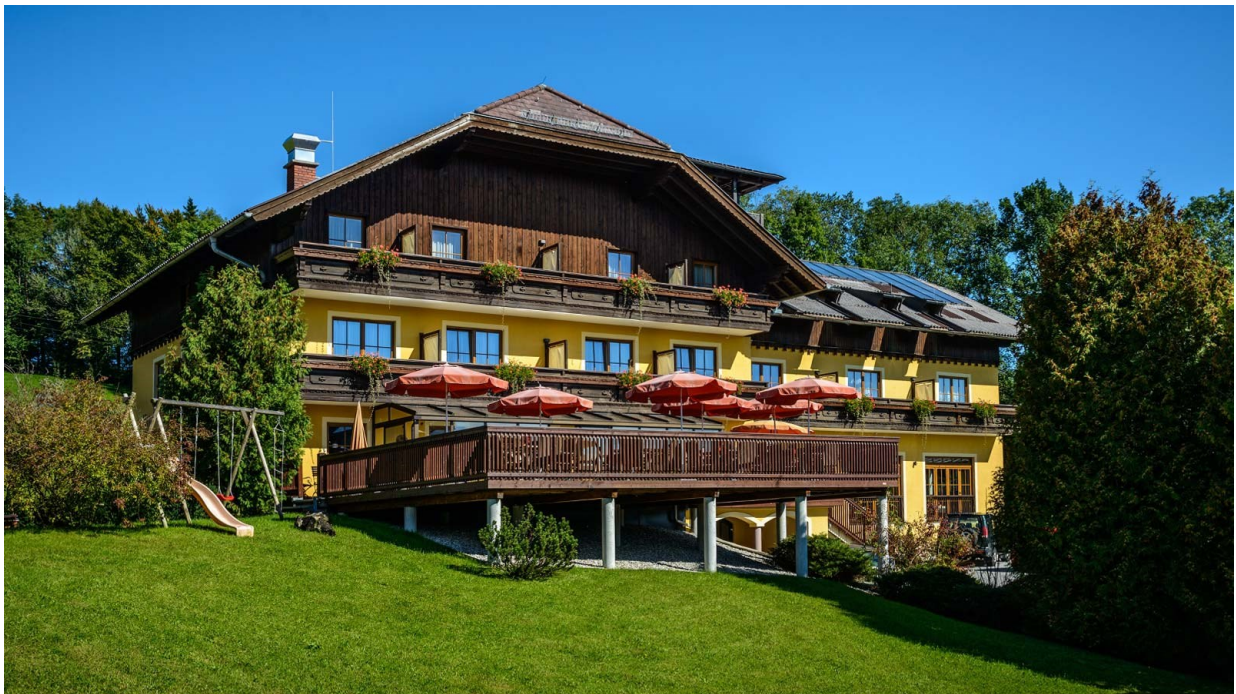
Abbildung 7: Hotel Pension Schwaighofen