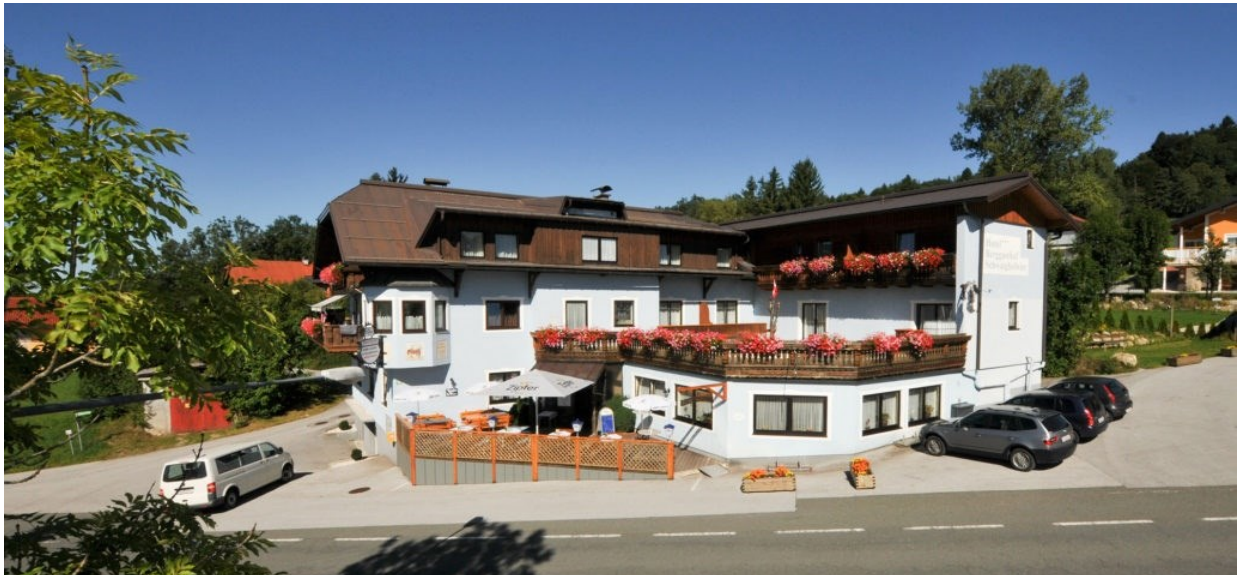
Abbildung 6: Hotel-Berggasthof Schwaighofwirt