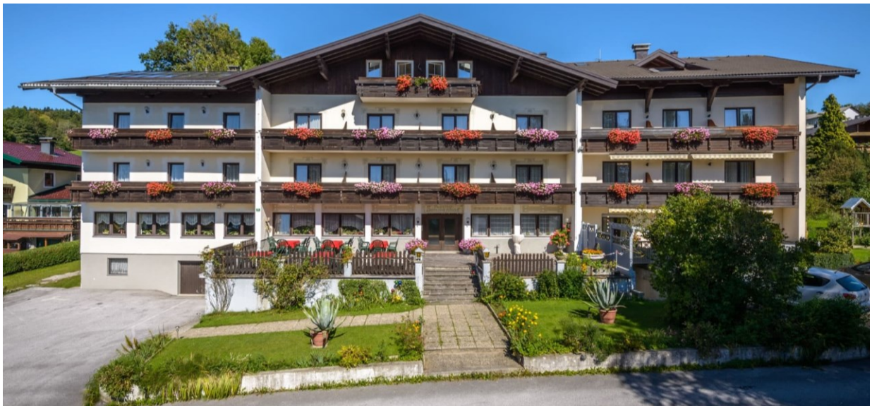
Abbildung 8: Pension Sonnenhof