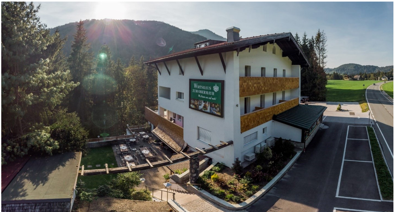
Abbildung 11: Hotel Obermayr