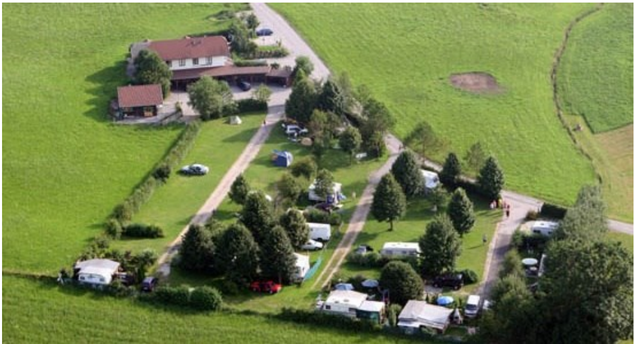
Abbildung 3: Camp24

[W] http://www.camping-salzburg.at/camping/home/