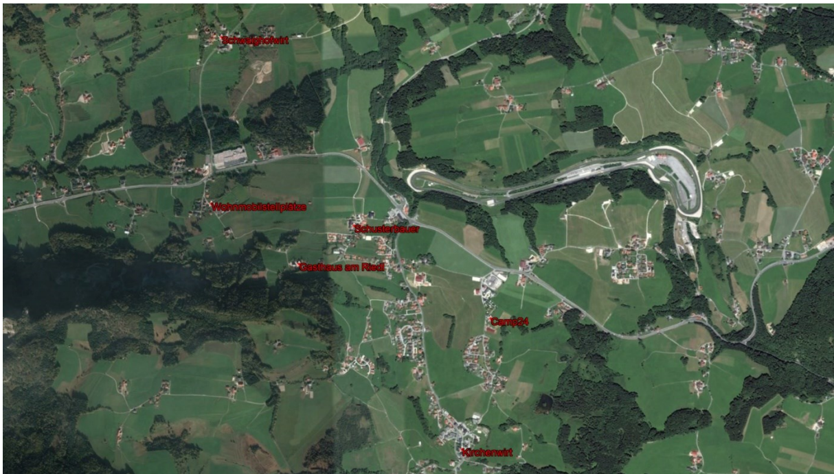
Abbildung 1: Unterkünfte in und um Koppl

Koppl bietet in direkter Lage zum Veranstaltungsgelände einige Unterkunftsmöglichkeiten (Abbildung 1). Wir können folgende Übernachtungsmöglichkeiten in der Nähe des Veranstaltungsgeländes empfehlen. Es wird empfohlen die Reservierung zeitnah durchzuführen, um Eure Schlafgelegenheit zu sichern. Details zu den Kosten und der vorhandenen Infrastruktur sind den jeweils genannten Webseite der Anbieter der Unterkunft zu entnehmen. > NocksteinTrophy_Unterkunft.kmz