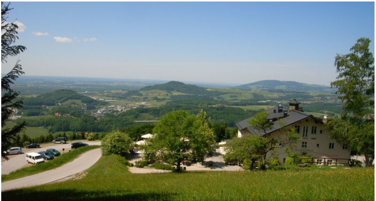
Abbildung 10: Hotel Dax Lueg