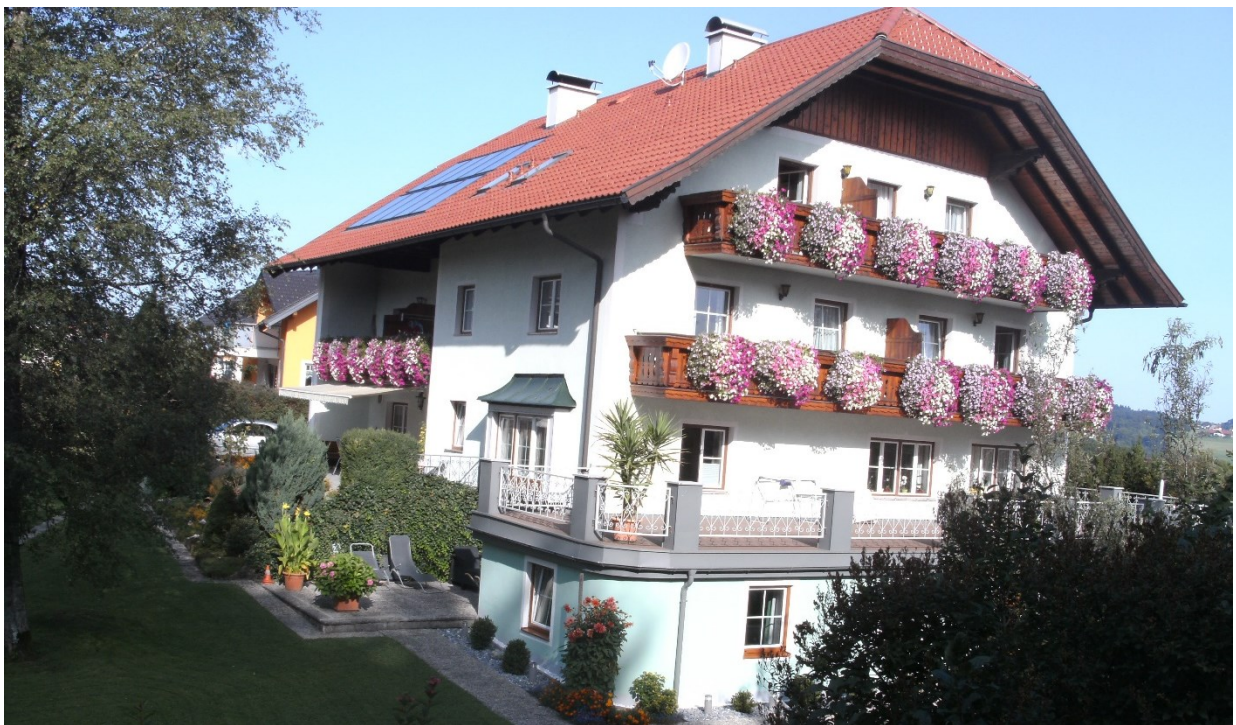
Abbildung 9: Pension Waldhof