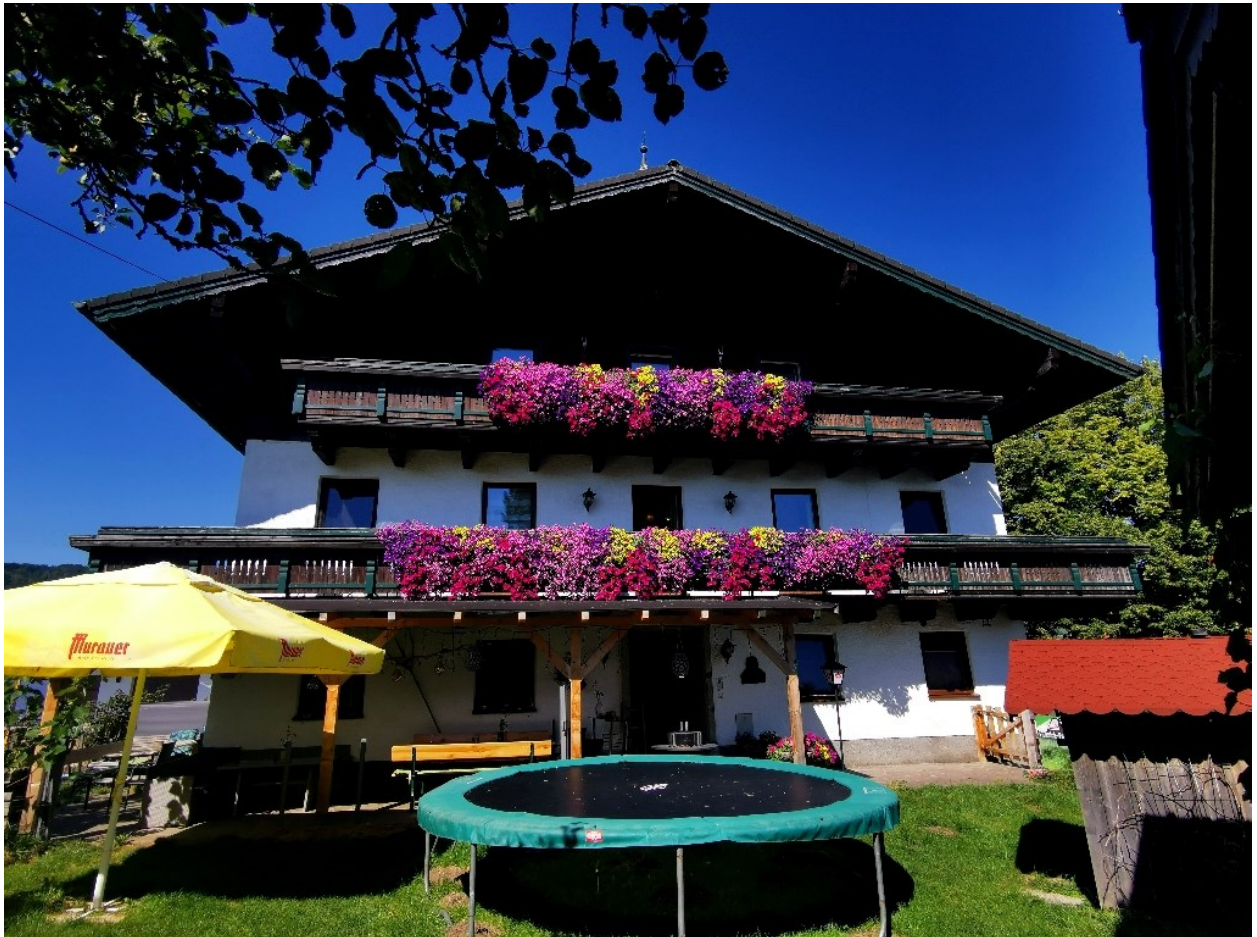
Abbildung 4: Der "Schusterbauer"