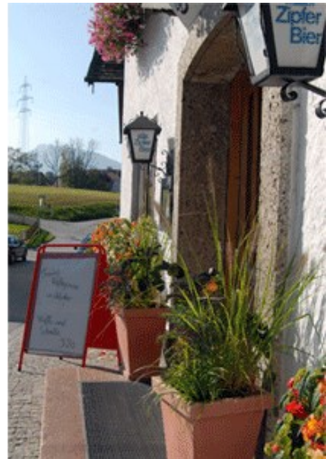
Abbildung 5: Gasthof Kirchenwirt